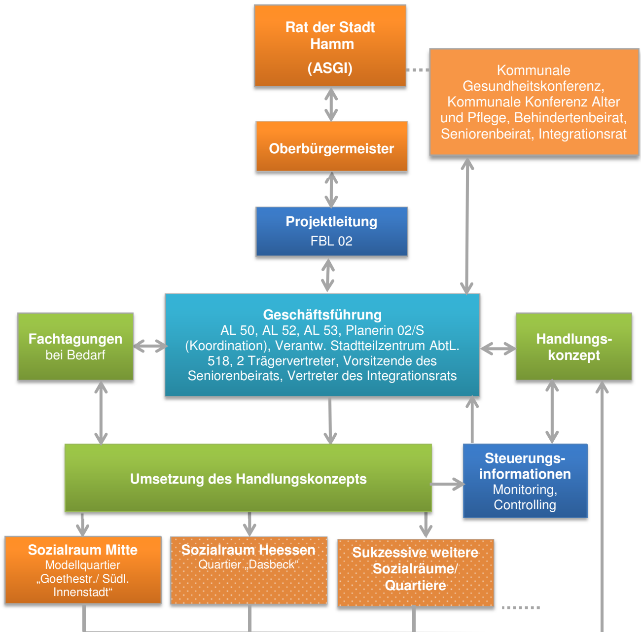
Abbildung 1: Projekt- und Gremienstruktur