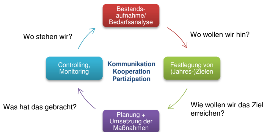
Abbildung 2: Prozesskreislauf

Wichtige Aspekte für die Umsetzung und den Erfolg der Maßnahmen sind die Kommunikation und Kooperation der Beteiligten und Akteure sowie die Partizipation der Betroffenen im Quartier und im Sozialraum.