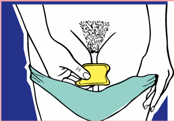
Binden zum Einlegen in den Slip

Die Menstruation oder auch Monatsblutung, Tage, Periode oder Regel dauert durchschnittlich vier bis fünf Tage und wird durch Hormone gesteuert. In den meisten Fällen setzt die Periode alle 25 bis 32 Tage ein. Anfangs ist die Blutung noch eher unregelmäßig. Binden und Tampons können verwendet werden, um das Blut aufzufangen.