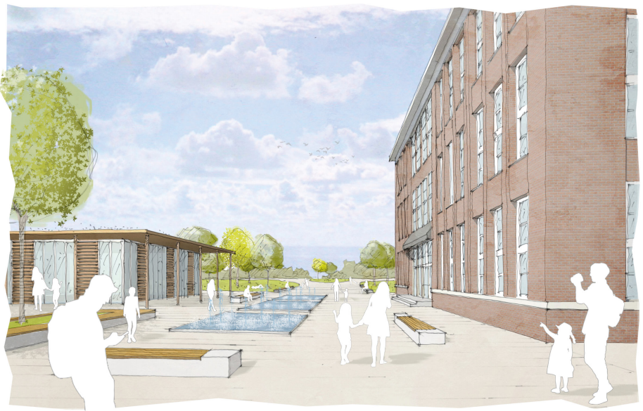
Als Auftakt in den Maximilianpark entsteht ein großzügiger Entreeplatz mit einem Wasserspiel und dem neuen Pavillon