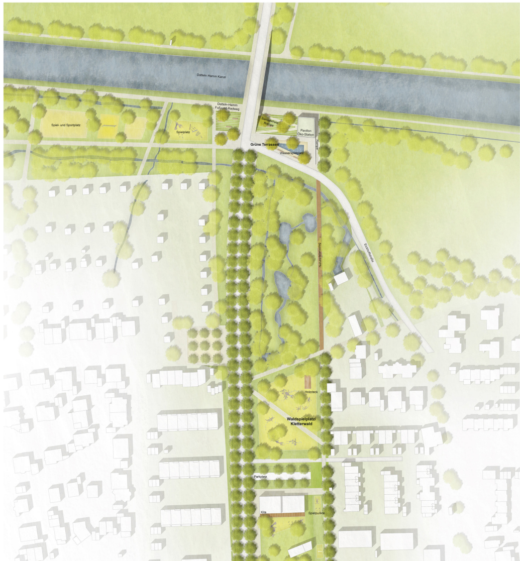
Lageplan Verteilungsbereich Nord M 1:500