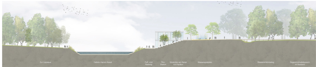
Nord-Süd Schnitt der grünen Terrassen am Datteln-Hamm-Kanal M 1:200