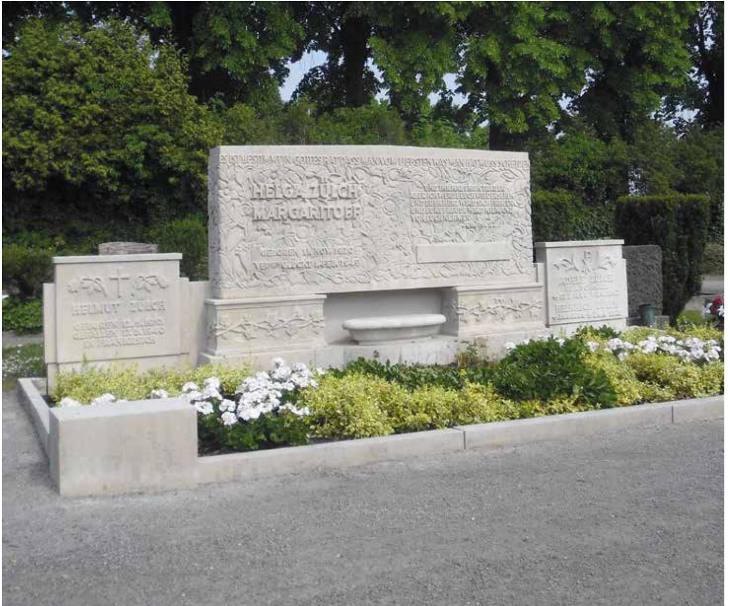
Historischer Grabstein auf dem Friedhof Hövel