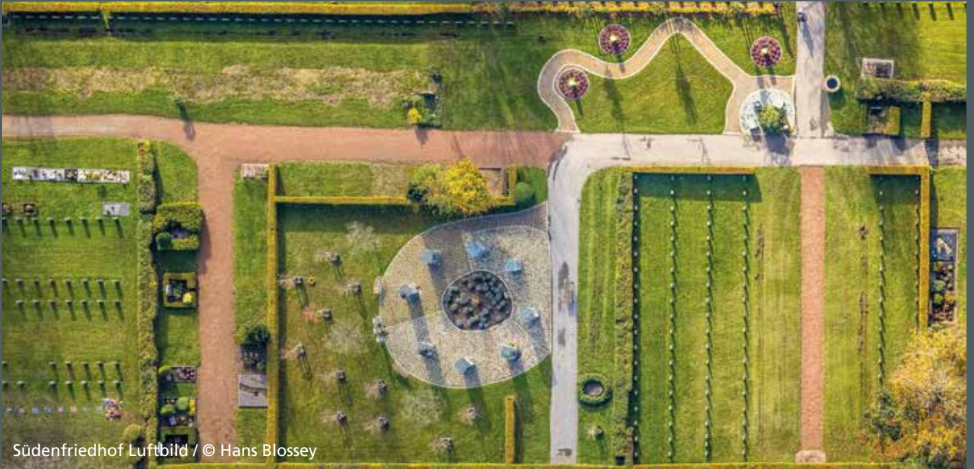
Südenfriedhof Luftbild