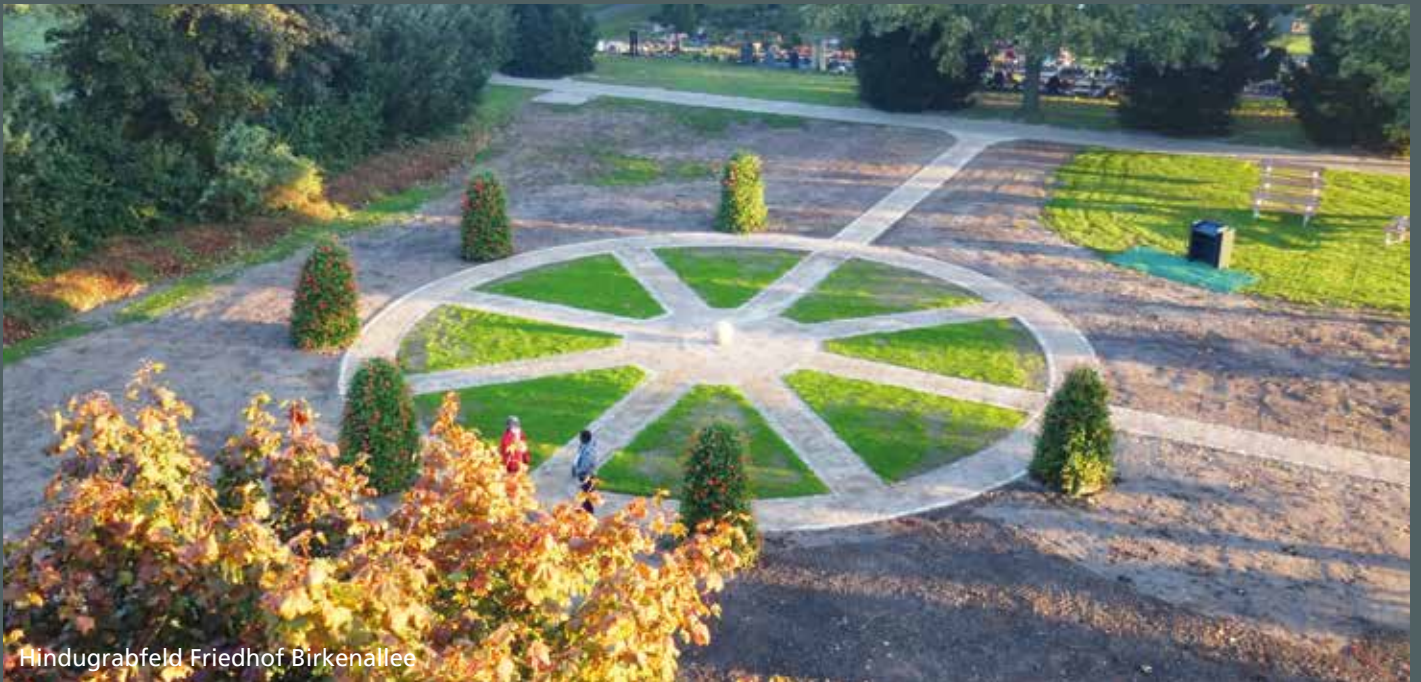
Hindugrabfeld Friedhof Birkenallee